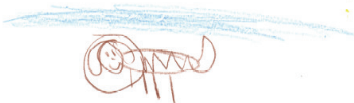
Chocolātus caelum explōrat.