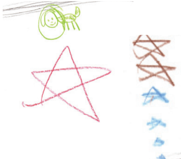
Chocolātus astra explōrat.